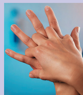
Palma de una mano con dorso de la otra.