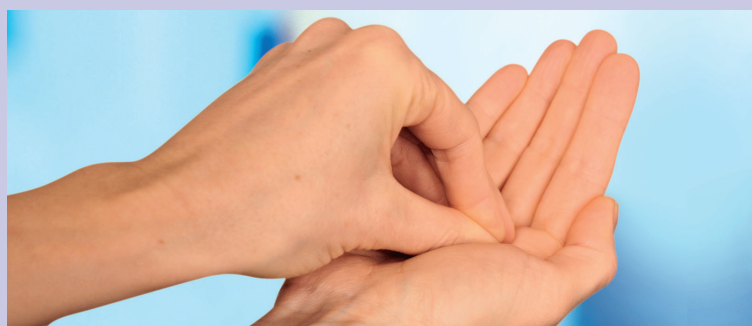
Con rotaciones, friccionar las yemas de los dedos sobre la palma de la mano contraria.