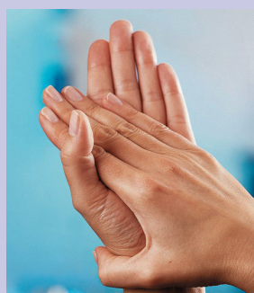
Frotar muñecas y palma con palma.