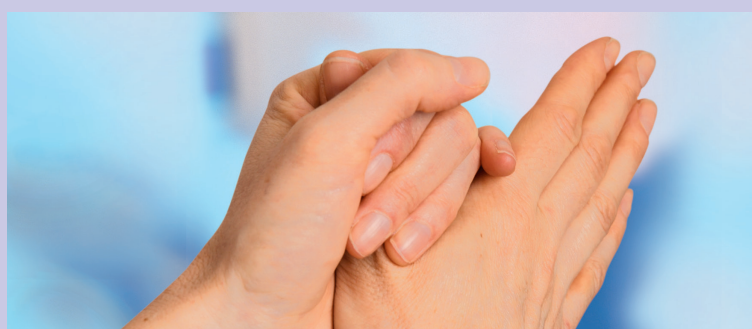
Friccionar por rotación el pulgar dentro de la palma contraria.