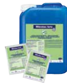
Dezinfekcia bez obsahu aldehydov