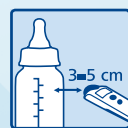
Objets ex. biberon