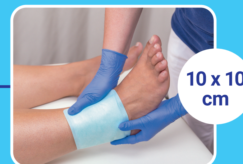
10 x 10 cm