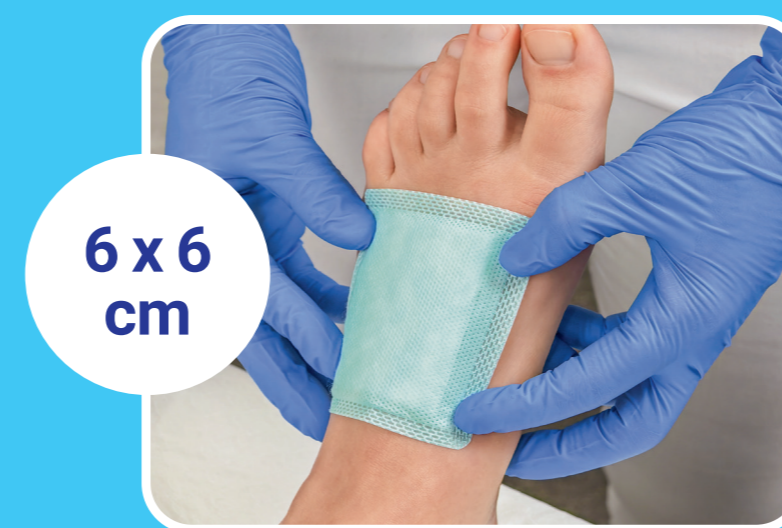
6 x 6 cm