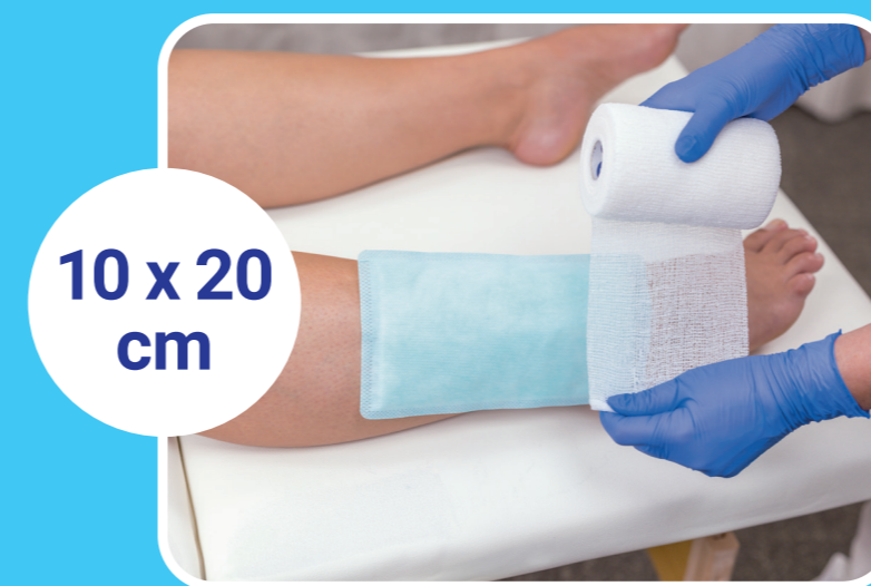
10 x 20 cm