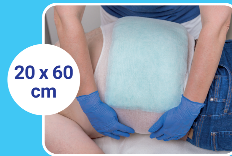
20 x 60 cm