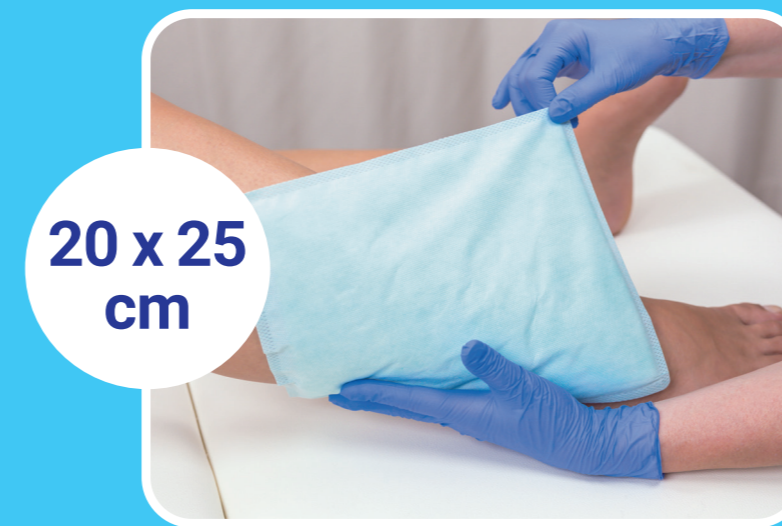
20 x 25 cm