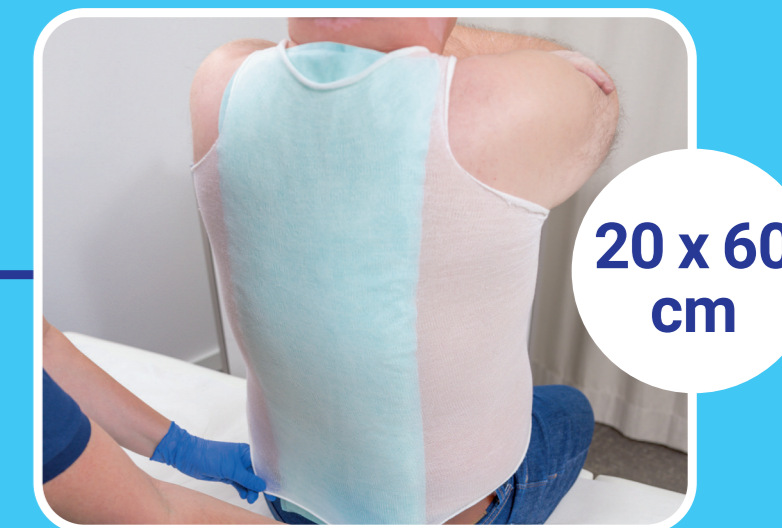
20 x 60 cm