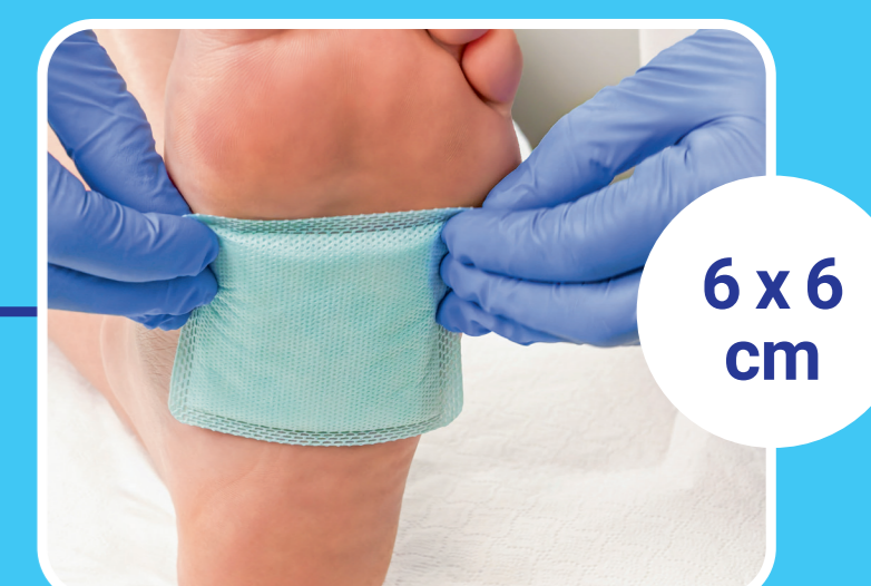
6 x 6 cm