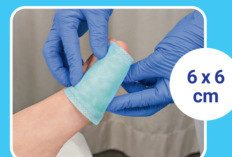
6 x 6 cm