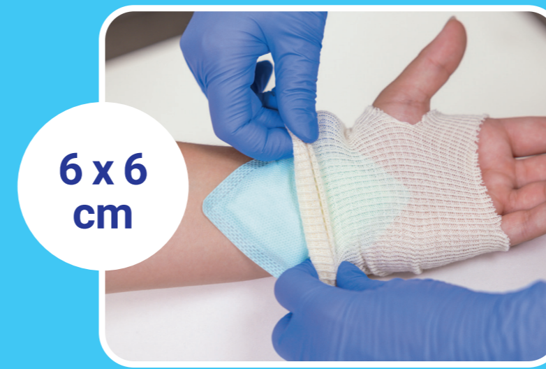
6 x 6 cm