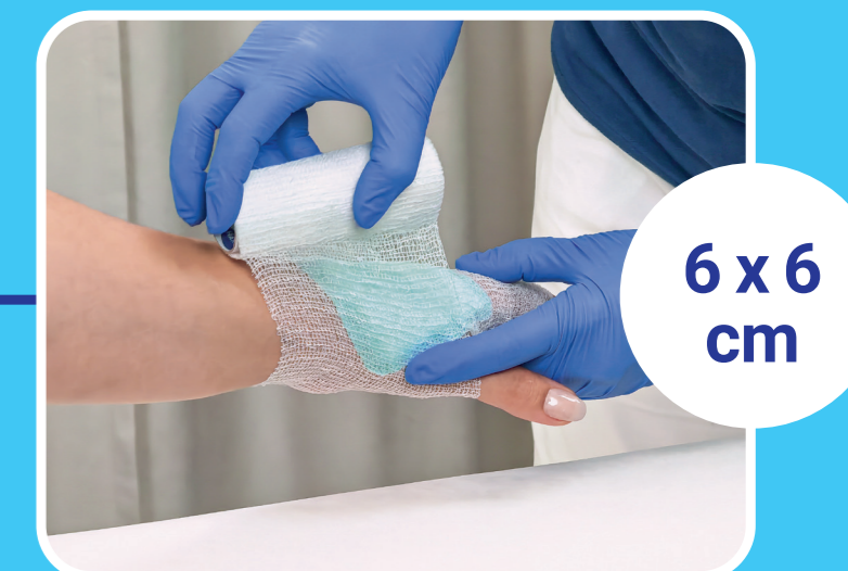
6 x 6 cm