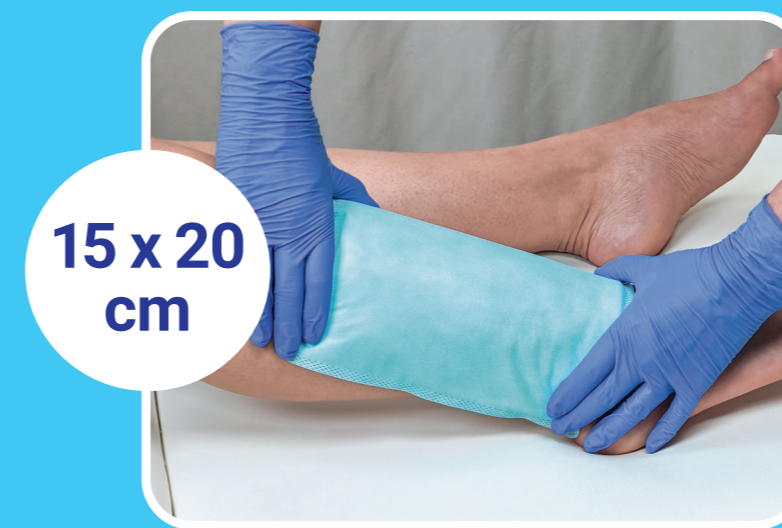
15 x 20 cm