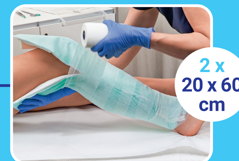
2 x 20 x 60 cm